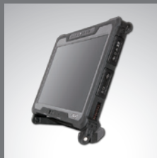
A140 的多功能坚固把手可作为支撑架使用