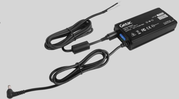
Versión con cable pelado