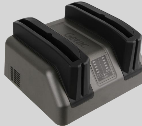
Foto del producto

Código SKU: GCMC*G * EU = E, US = U, UK = K, AU = A, PR = C, TW = T - Cables de alimentación