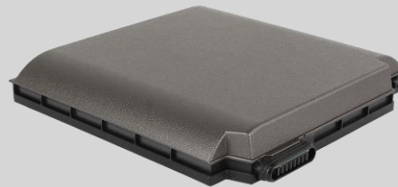
Foto del producto