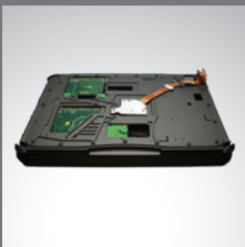
PCI/PCI-Express 3.0 扩展槽