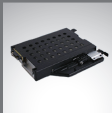
多媒体扩展仓 第 2 个存储装置