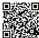
B360 3D demo